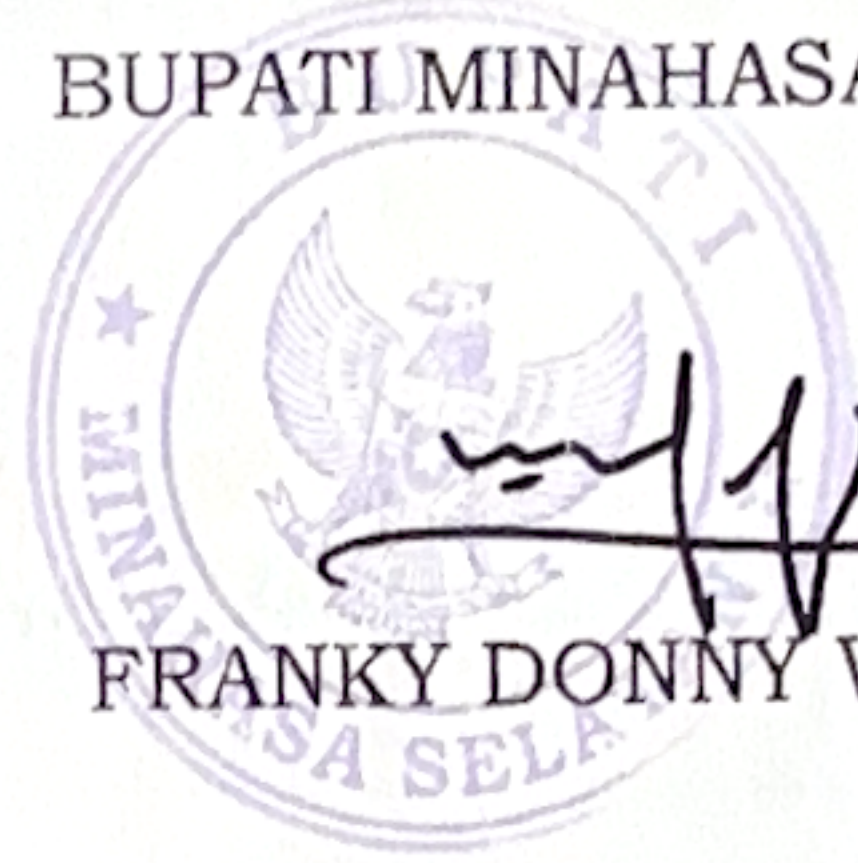
FRANKY DONNY WONGKAR

Ditetapkan di Amurang pada tanggal 14 Agustus 2025 BUPATI MINAHASA SELATAN,